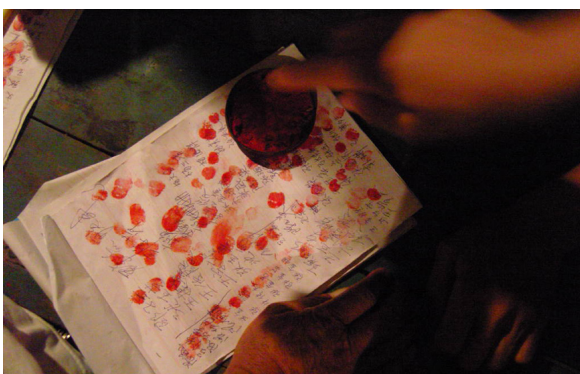
《仇岗卫士》剧照.02 1801名仇岗村民的请愿信