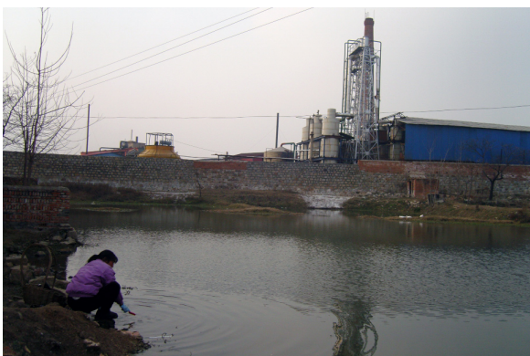
《仇岗卫士》剧照.03 化工厂墙外的池塘