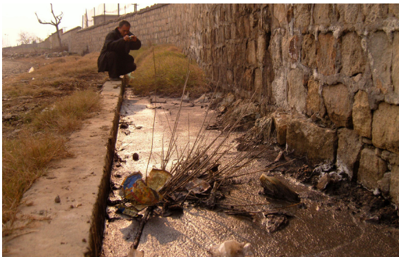
《仇岗卫士》剧照.01 仇岗村化工厂墙外